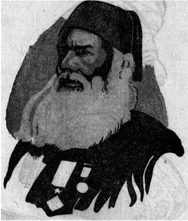
सर सैयद अहमद